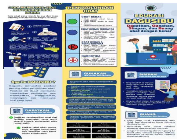
Gambar 2. Leaflet DAGUSIBU