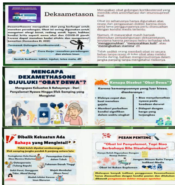
Gambar 1. Materi Penyuluhan (Slide Power Point)

Untuk memperkuat pemahaman peserta, tim penyuluh juga menayangkan video edukatif DAGUSIBU (Dapatkan, Gunakan, Simpan, dan Buang obat secara tepat) berdurasi 3 menit yang menampilkan contoh kasus penyalahgunaan Dexametason di masyarakat serta panduan pengelolaan obat yang benar. Video ini dibuat di kampus Institut Sains dan Teknologi Al-Kamal sebagai bagian dari kegiatan edukasi visual yang menarik dan mudah dipahami oleh peserta.