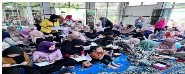
Gambar 4. Pembagian Kuisioner DAGUSIBU Pre Test

Sebagai upaya untuk mengukur efektivitas kegiatan penyuluhan, tim pelaksana membagikan lembar kuesioner kepada peserta sebelum kegiatan dimulai (pre-test) dan setelah penyuluhan selesai (post-test). Data yang diperoleh dari kuesioner tersebut kemudian dikompilasi dan dianalisis guna menilai sejauh mana peningkatan pemahaman masyarakat serta mengevaluasi keberhasilan kegiatan Pengabdian kepada Masyarakat (PkM) ini.