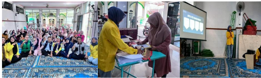
Gambar 3. Pelaksanaan Kegiatan PkM