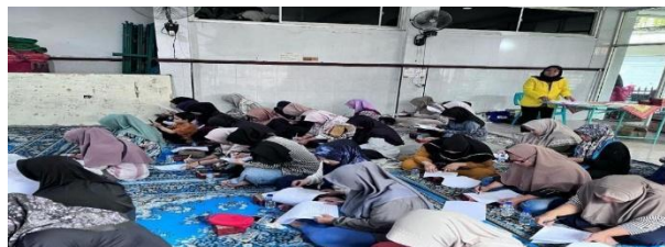
Gambar 5. Pembagian Kuesioner DAGUSIBU Post Test