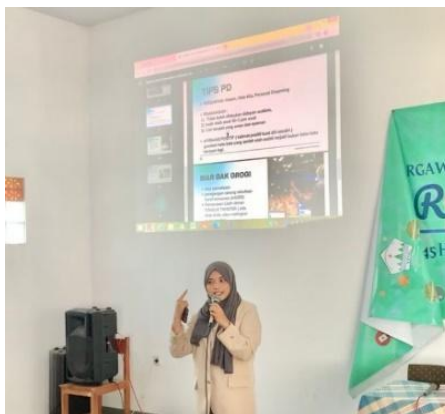
Gambar 3. Penyampaian Materi

komunikasi itu sendiri. Kemudian, pengertian public speaking dijelaskan secara mendalam, diikuti dengan identifikasi berbagai masalah yang sering muncul dalam praktiknya, serta solusi untuk mengatasinya.