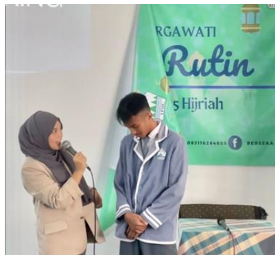
Gambar 2. Assesment oleh pembicara

Kegiatan pengabdian ini dimulai dengan penilaian melalui observasi dan wawancara singkat dengan guru Bimbingan Konseling untuk kemampuan public speaking . Saat berbicara di depan audiens, banyak peserta yang mengalami rasa malu, cemas, dan kurang percaya diri.