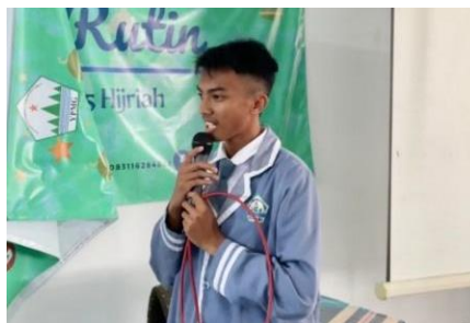
Gambar 4. Peserta tampil public speaking

Peserta diminta menceritakan hal yang membuat mereka bersyukur, berbagi pengalaman, berimprovisasi, mendeskripsikan kelebihan peserta lain, serta praktik menjadi MC dan berpidato. Pada bagian akhir sesi pelatihan, siswa diberikan kesempatan untuk mencoba berbicara di depan umum untuk melihat kemampuan masing-masing peserta.