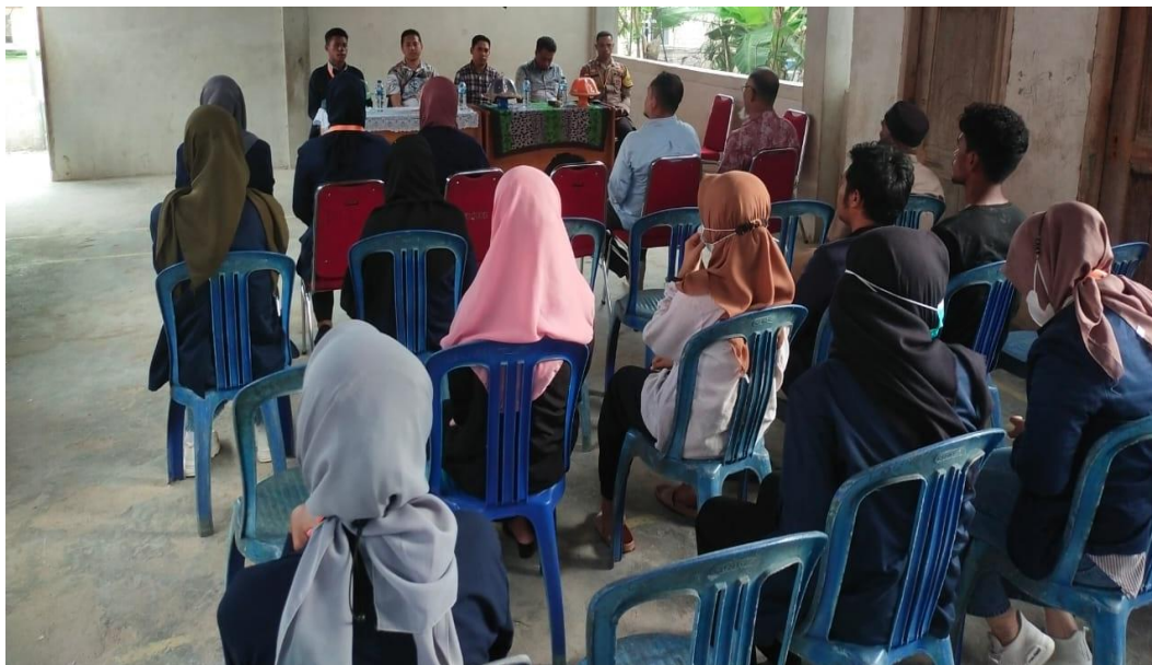
Gambar 1. Koordinasi tim PKM dengan Kepala Desa Lolibu, Aparatur Desa Lolibu beserta Aparat Keamanan Desa Lolibu