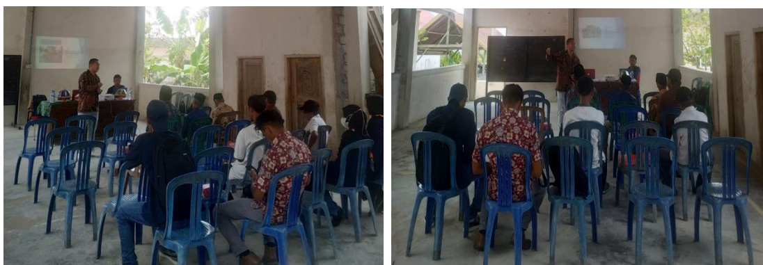
Gambar 2. Workshop Kebersamaan dalam menjaga kebersihan Lingkungan

Tujuan kegiatan ini adalah mengingatkan dan membangkitkan kesadaran masyarakat akan pentingnya lingkungan untuk kehidupan, bukan hanya untuk saat ini tetapi juga di masa yang akan datang. Selain itu juga mengajak untuk mengurangi sampah dengan mengelola sampah yang dihasilkan dan mengurangi kerugian yang akan dialami oleh lingkungan. Kegiatan workshop ini di hadiri oleh Aparatur Desa Lolibu, Tokoh Agama, Tokoh Masyarakat, Tokoh Pemuda Dan Karangtaruna Desa Lolibu.