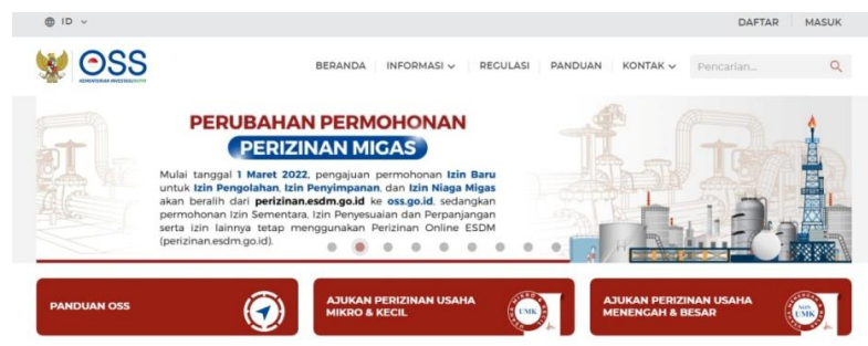
Gambar 4. Tampilan Laman url : https://oss.go.id/ dan Kolom Daftar berada di pojok atas

Dalam melakukan praktek pendaftaran izin usaha melalui laman OSS Bapak Ruslan Fauzi, S.Pd. sebagai narasumber memberikan tahapan alur dalam pembuatan izin usaha. Tahapan pengajuan perizinan usaha melalui online yaitu : 1. Mengunjungi laman url : https://oss.go.id/ klik tombol daftar dipojok kanan atas. 2. Pilih menu UMK. 3. Pilih jenis usaha, masukkan nomor handphone aktif, dan email aktif 4. Kirim kode verifikasi melalui email (disarankan) 4. Konfirmasi dan ikuti langkah yang diminta oleh sistem 5. Cetak izin usaha yang telah disetujui.