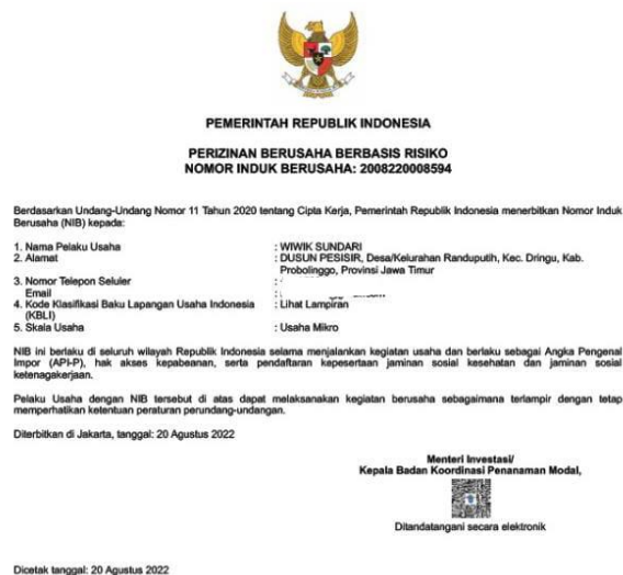
Gambar 7. Output izin usaha melalui Online Single Submission (OSS)

Praktek yang dilakukan oleh Bapak Ruslan Fauzi, S.Pd. sebagai narasumber tersebut di praktekkan langsung kepada salah satu peserta UMKM yang bernama Ibu Wiwik Sundari yang bergerak di bidang usaha olahan ikan. Praktek yang dilakukan di depan semua peserta UMKM berjalan dengan lancar karena peserta UMKM memperhatikan dengan seksama dan acara berlansung lancar. Meskipun ada beberapa dari peserta UMKM yang kesulitan dalam pendaftaran izin usaha akan dilakukan pendampingan secara berkala oleh mahasiswa KKN Universitas Panca Marga Probolinggo yang akan dilaksanakan ke esokan harinya pada hari Senin, tanggal 22 Agustus 2022.