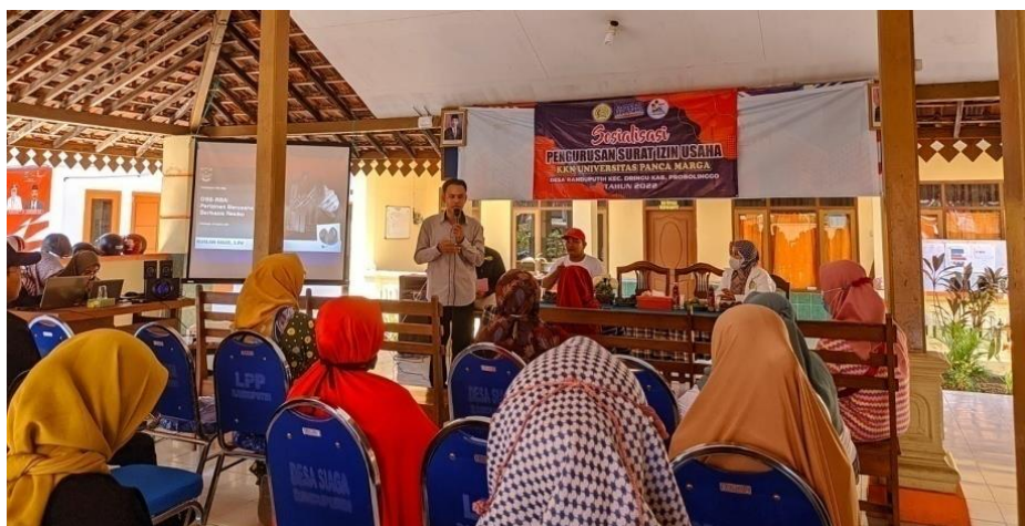
Gambar 1. Pemberian materi kepada peserta UMKM

Metode Sosialisasi, praktek dan pendampingan yang dilakukan pemateri dan mahasiswa selama kegiatan pembuatan izin usaha mealui Online Single Submission (OSS) mendapatkan antusias yang luar biasa dari peserta UMKM sehingga dapat mengikuti acara hingga selesai.