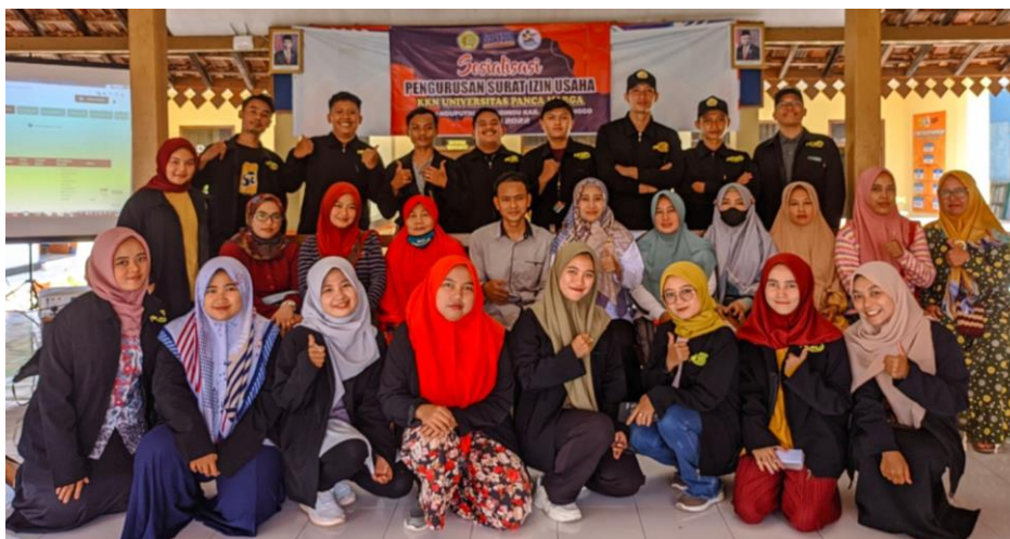
Gambar 8. Foto bersama narasumber, mahasiswa KKN, dan pelaku UMKM

Kemudahan yang terdapat di laman OSS membantu para pelaku UMKM untuk mendapatkan legalitas dalam berwirausaha. Antusiasme para UMKM juga memberikan pengaruh positif bagi narasumber dan mahasiswa KKN sehingga acara yang diselenggarakan dapat berjalan lancar dan efektif. Kegiatan sosialisasi, praktek dan pendampingan izin usaha melalui Online Single Submission (OSS) ini sangat memberi manfaat pada aspek legalitas usaha, serta membantu para UMKM untuk mampu mengembangkan usahanya dengan baik, mempermudah akses permodalan dan pelatihan yang diselenggarakan instansi terkait, meningkatkan keunggulan produk dalam bersaing, dan meningkatkan kepercayaan konsumen terhadap kualitas produk.