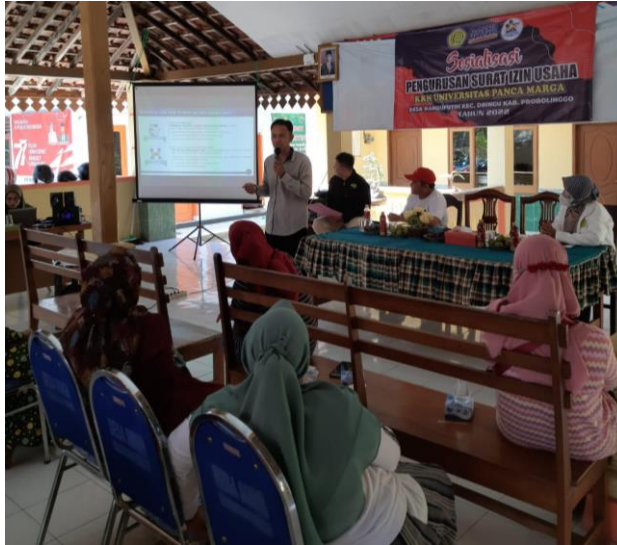
Gambar 2. Praktek pembuatan izin usaha melalui OSS oleh narasumber