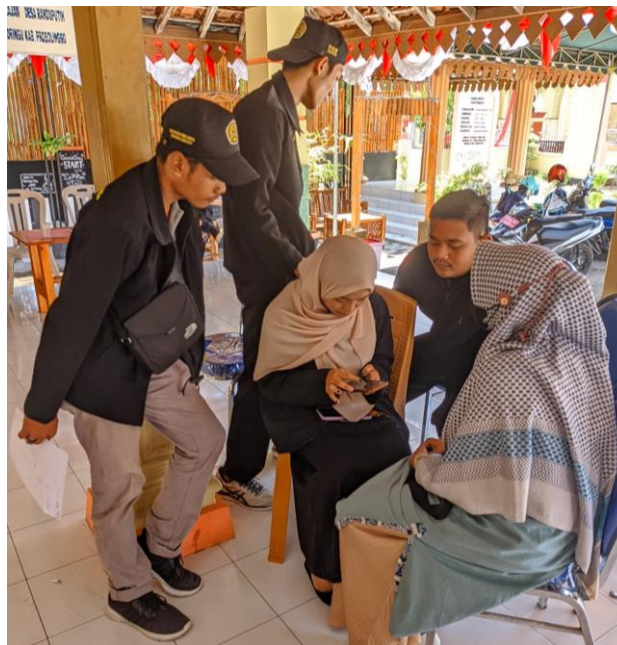
Gambar 3. Pendampingan pembuatan izin usaha melalui OSS oleh Mahasiswa KKN